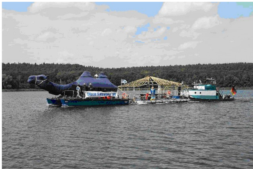
Abb. 5 Blaue Karawane 2009 von Berlin über Brandenburg, Wolfsburg nach Bremen

Bei ihren Reisen 1994, 2000 und 2009 zog die Blaue Karawane in West- und Ostdeutschland zu Orten der sozialen Ausgrenzung, um für einen anderen Umgang mit Menschen, für soziale Inklusion zu werben. Sie zog mit Wasserfahrzeugen über Flüsse und Kanäle und ihr voran immer die neue Symbolgestalt: Das Blaue Kamel namens „WÜNA“ („Wüstennarrenschiiff“), flauschig, blau, 12 Meter lang, 2,4 Meter breit und bis zum Kopf 5,4 Meter hoch. Das Symboltier „WÜNA“ war eigens für die Karawane von langzeitarbeitslosen Werft-, Tischlerei- und Polsterei-Mitarbeitern, Künstlern, Schülern, Studenten u.a. erschaffen worden – ebenso wie der extra für das Blaue Kamel konstruierte Katamaran.