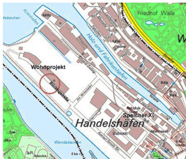
Abb. 2: Das BlauHaus in der Überseestadt

Für die Blaue Karawane war es keine Frage, sich an dem Großprojekt an der Hafenkante zu beteiligen. Hier soll nun das BlauHaus entstehen und ein alternativer Treffpunkt für alle werden.