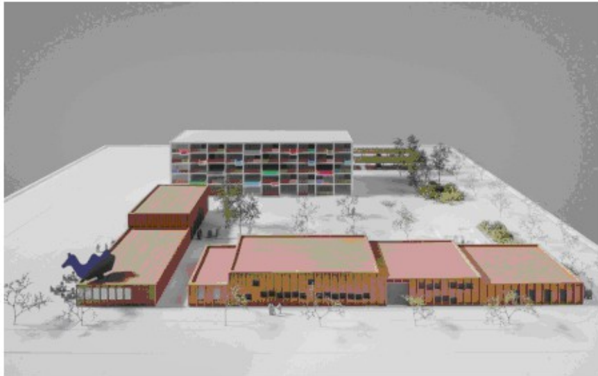
Abb. 3: Das BlauHaus (Modell des Architekturbüros)

Im BlauHaus soll eine gemischte Lebensform entstehen, wo Normale und Verrückte, Behinderte und Nichtbehinderte, Arbeitende und Arbeitslose, Alte und Junge in gemeinschaftlichen Zusammenhängen leben. Es wird im Norden der bisherigen Blauen Karawanserei entstehen, die dann aus dem Speicher XI dorthin umziehen wird.