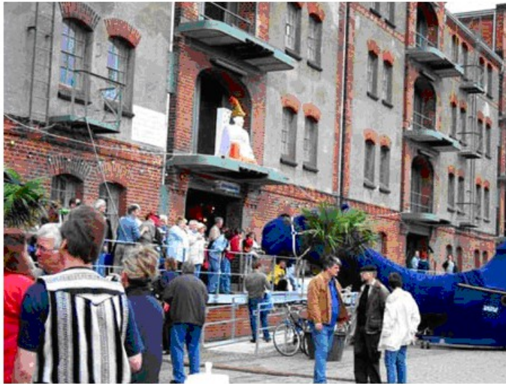
Abb. 6 Einzug des Blauen Kamels "WÜNA" in den Speicher XI

Mit diesen und vielen anderen politischen und künstlerischen Aktionen, natürlich auch durch den Betrieb des Café Blau und die Herausgabe der Zeitung „Die Blaue Karawane“ (erstmalig 2008), hat sich die Blaue Karawane großen Respekt in der politischen und zivilgesellschaftlichen Öffentlichkeit verschafft. Dies drückt sich aus in der Verleihung des Kultur und Friedenspreises der Villa Ichon an die Blaue Karawane und an Blaumeier im Rathaus der Stadt Bremen.